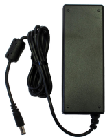
Netzteil 48 V DC, 1.25 A für L-SW-5700 Netzteil 48 V DC, 1.25 A