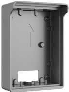
L-RA-5701-AP2 Aufputzrahmen für Single Türstation