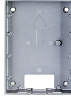
L-RA-5701-AP Aufputzrahmen für Single Türstation