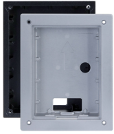
L-RA-5701-UP Unterputzrahmen für Single Türstation