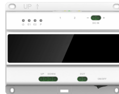
L-SW-5700 2-Draht-Switch für lunaIP Intercom