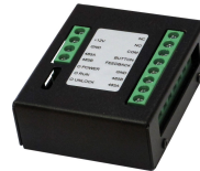
L-ER-5020 Türsprechanlagen Erweiterungsmodul