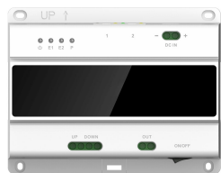
L-SW-5700 2-Draht-Switch für lunalP Intercom