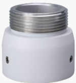
L-HA7 Adapter für Domekameras